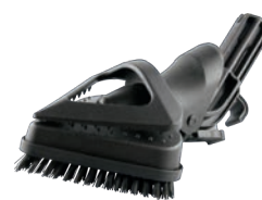
Bürste, dreieckig ca. 12,5cm x 12,5cm x 12,5cm