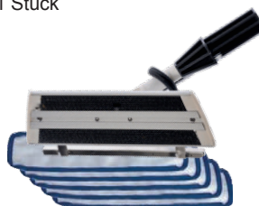
Boden-Wischnopp inkl. 10 MF-Mopp-Pads