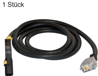
Dampfschlauch 24/7 Länge: 5m