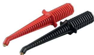
Dampflanze schwarz / rot