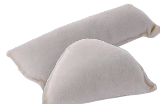
Dampfpuffer, genäht dreieckig / viereckig