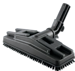
Bürste, rechteckig ca. 26,5cm x 9,0cm