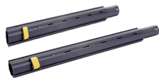
Verlängerung, 4x lang / 1x kurz Länge: 41,5cm / 22,0cm