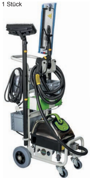
MCT Microcleaner mit Gerätewagen „Hotellerie“