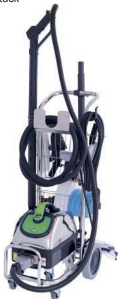
MCT Microcleaner mit Gerätewagen „Arena Plus“