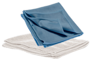
Thermo Mikrofaser Tuch