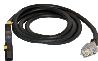
Dampfschlauch 24/7 Länge: 5m